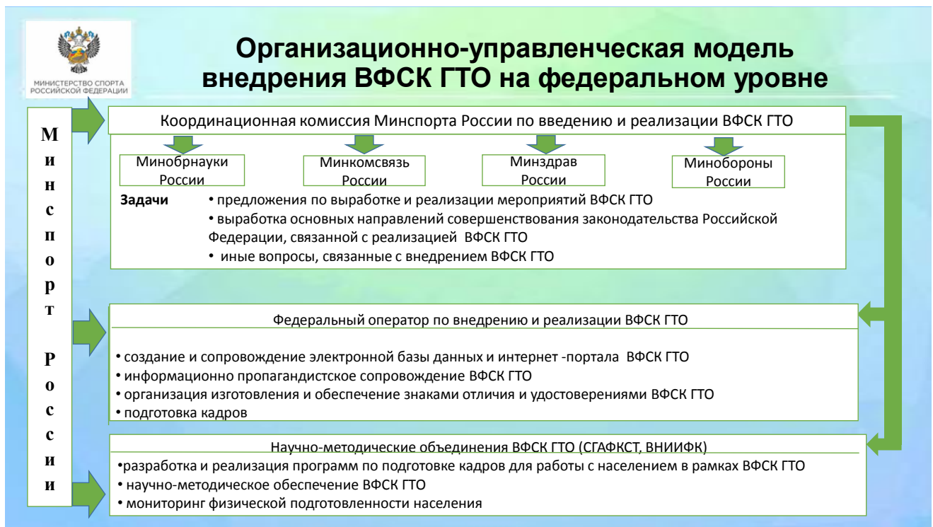
Рис. 1. Модель управления процессом внедрения комплекса ГТО на федеральном уровне

Наиболее близким к непосредственной работе с населением звеном в системе взаимодействия при управлении сферой физической культуры и спорта в регионе является муниципальный уровень.